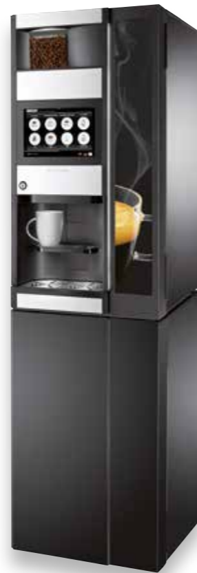
Der elegante Unterschrank passt perfekt zum Design der Maschine.